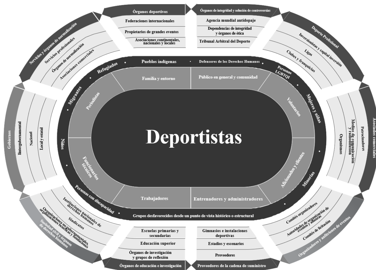
Figura I Modelo de las partes interesadas en el ecosistema deportivo mundial