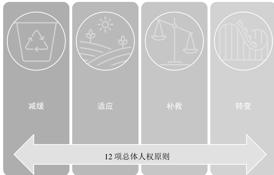
图一 四大支柱——气候公正框架

和生活方式的转型将补充其他三大支柱的目标。此外，12项总体人权原则应贯穿气候公正的四大支柱(见图一)。