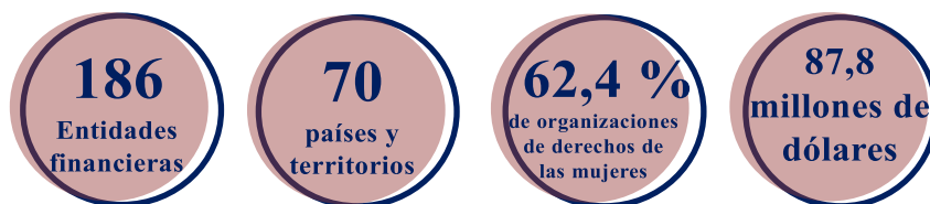
Figura I Cartera administrada por el fondo fiduciario en 2022

5. En diciembre de 2022 contribuían al fondo fiduciario los Gobiernos de Alemania, Australia, Austria, el Canadá, Eslovenia, los Estados Unidos de América, Irlanda, Liechtenstein, Noruega, los Países Bajos, el Reino Unido de Gran Bretaña e Irlanda del Norte, Suecia, Suiza y Trinidad y Tabago. También se recibió apoyo de los comités nacionales de ONU-Mujeres de Australia, los Estados Unidos de América, los Países Bajos y Suecia, de la Iniciativa Spotlight de la Unión Europea y las Naciones Unidas y de asociados como Conscious Step, Soko y el Wellspring Philanthropic Fund.