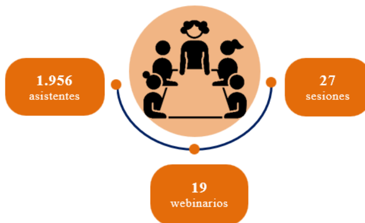
Figura III Alcance del desarrollo de capacidades en 2022

subvencionadas activas y la puesta en común de buenas prácticas de promoción en los medios sociales y promover un entorno propicio para todos a través del aprendizaje.