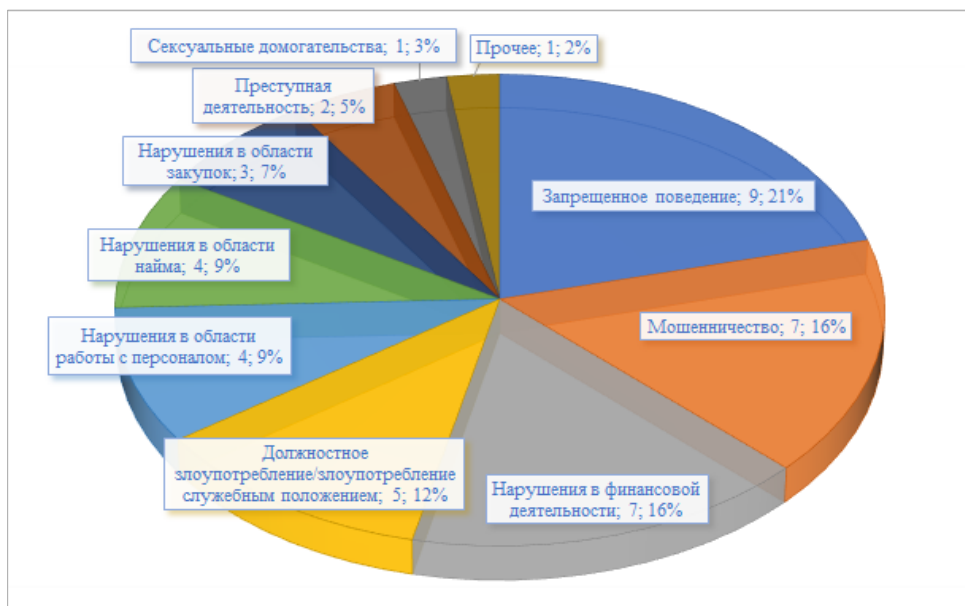
Рисунок 2 Заявления, полученные в 2020 году, в разбивке по виду, количеству и процентной доле от общего числа