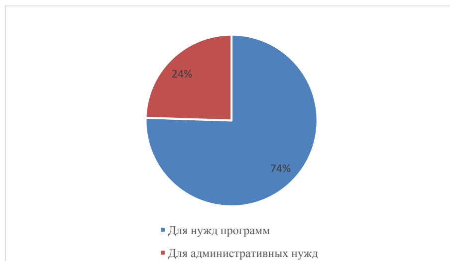
Диаграмма 2 Характер совместной закупочной деятельности в 2016 году

9. В таблице 2, приведенной ниже, представлены десять основных категорий товаров и услуг, которые приобретались в рамках совместных инициатив и мероприятий; эти данные иллюстрируют разнообразие совместной закупочной деятельности ПРООН, ЮНФПА и ЮНОПС в 2016 году.