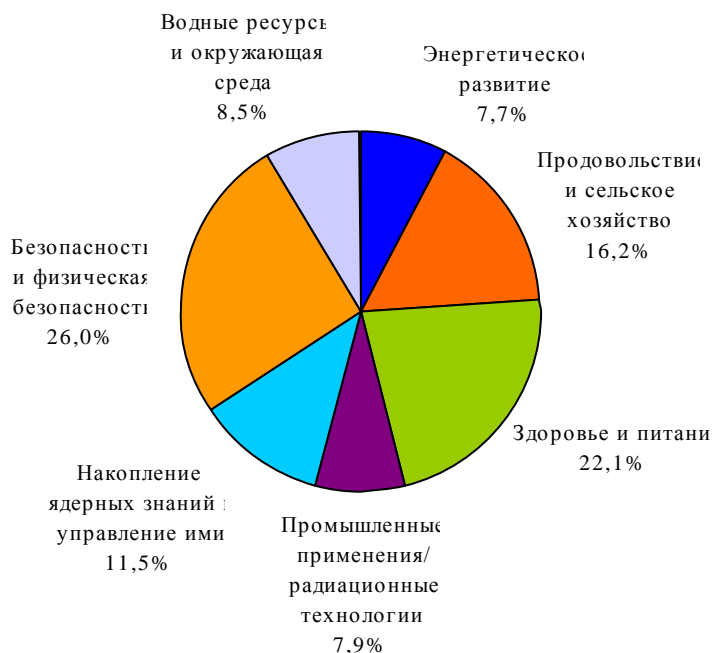
Диаграмма 4 Выплаты по техническим областям в 2014 году — Азия и Тихий океан

В ответ на увеличивающуюся потребность региона в электроэнергии и растущий интерес государств-членов из этого региона к ядерной энергетике МАГАТЭ усиливает свою поддержку в энергетической области, делая особый упор на разработке комплексных планов работы в странах, приступающих к освоению ядерной энергии.