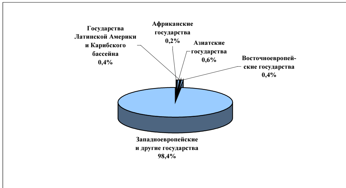
Рисунок 1 Поступление взносов в разбивке по региональным группам