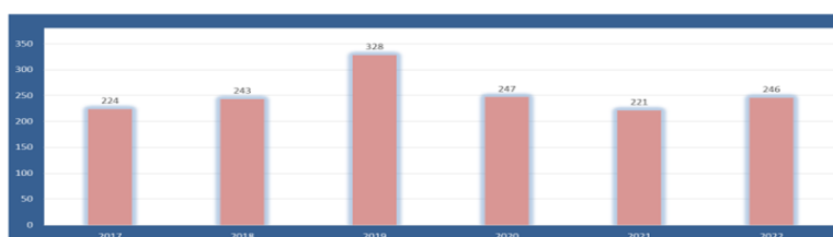
Referrals to S-CAP over the years