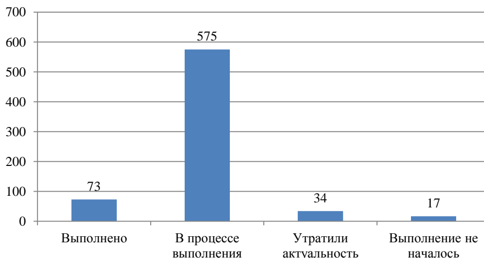
Диаграмма III Ход выполнения рекомендаций Постоянного форума